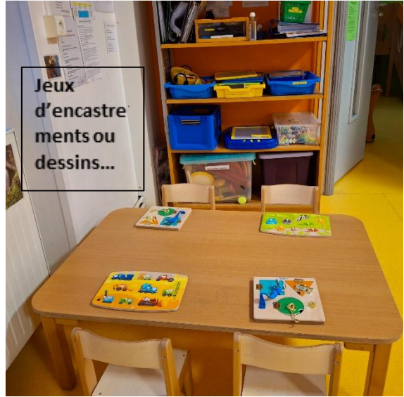
Jeux d'encastres ou dessins...