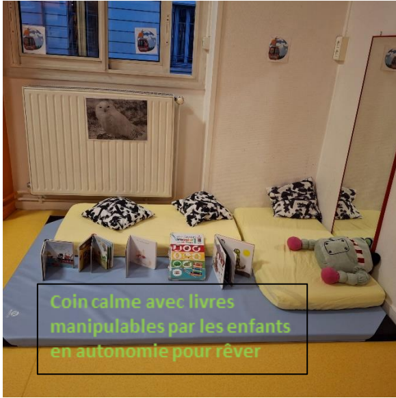
Coin calme avec livres manipulables par les enfants en autonomie pour rêver